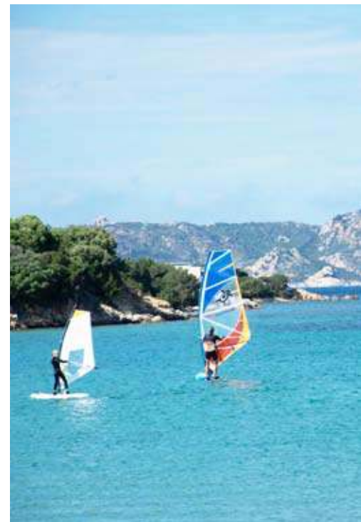
Terras bij Capo Testa; de haven van Porto Rotondo; in het dorpje Aggius; surfen bij Porto Pollo.

Een uurtje later kom ik bij het beroemde Porto Cervo, de speeltuin van de rich & famous . Het dorp ligt prachtig aan een baai met helblauw water. Niet voor niets heet dit stukje kust de Costa Smeralda, de smaragd kust. Echte inwoners heeft >